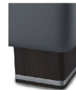
H 05-10 H 05-15 Holzfuß wengefarbig gegen Aufpreis