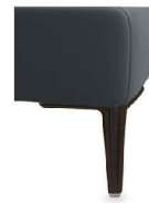
A11-10/M01 A11-15/M01 Alufuß schwarz matt gegen Aufpreis