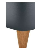
H25-10 H25-15 Holzfuß Eiche natur geölt gegen Aufpreis