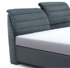
0850KV Höhe 112-123 cm nur lieferbar bei Bettgrößen 160-200cm Breite gegen Aufpreis

Bitte alle erforderlichen Vorgaben zu einer Bestellung beachten.