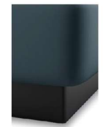
S08-10 S08-15 Bettsockel schwarz gegen Aufpreis nicht möglich bei Motor