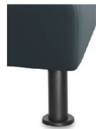
M24-10 M24-15 Metallfuß schwarz Standard