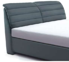
0850 Höhe 112 cm nur lieferbar bei Bettgrößen 160-200cm Breite Standard