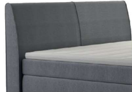
0023 Höhe 106 cm