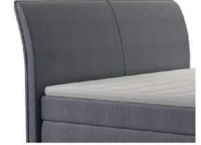
0022 Höhe 106 cm