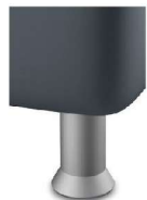
K01-10 K01-15 Kunststofffuß alufarbig preisgleich