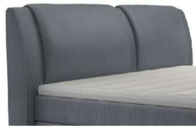
0327 Höhe 108 cm