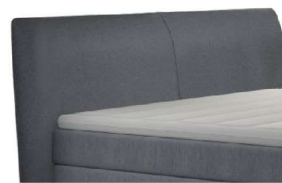
0689 Höhe 119 cm