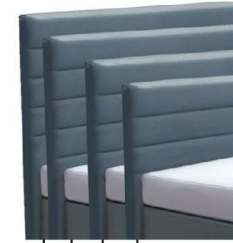
→ 0849S - Höhe 99 cm → 0849M - Höhe 109 cm → 0849L - Höhe 119 cm → 0849XL - Höhe 129 cm preisgleich