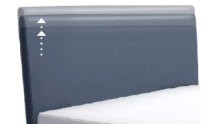
0300 Multimaß Höhe 55 - 125 cm in 5cm-Schritten kürzbar