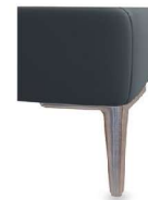
A11-10/M12 A11-15/M12 Alufuß gebürstet gegen Aufpreis