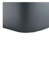
K08-10 K08-15 Schwebeoptik preisgleich nicht möglich bei Motor