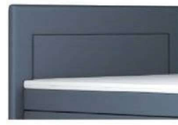
0025 Höhe 122 cm