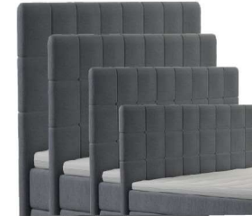
→ 0046S - Höhe 99 cm → 0046M - Höhe 109 cm → 0046L - Höhe 119 cm → 0046XL - Höhe 129 cm gegen Aufpreis