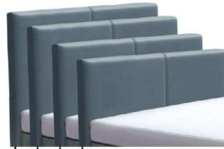
→ 0846S - Höhe 99 cm → 0846M - Höhe 109 cm → 0846L - Höhe 119 cm → 0846XL - Höhe 129 cm preisgleich