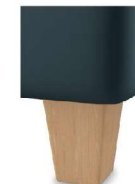
H17-10 H17-15 Holzfuß Buche natur lackiert gegen Aufpreis