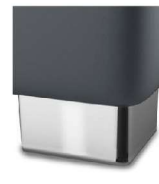
M 09-10 M 09-15 Metallfuß verchromt preisgleich